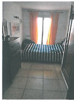
Schlafzimmer zum Innenhof