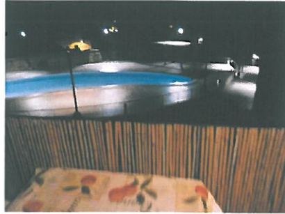
Blick vom Balkon auf Poolanlage