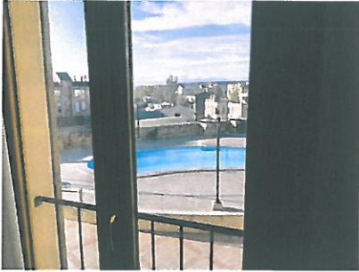
Blick aus Wohnzimmerfenster auf Gemeinschaftspool, Hintergrund Tramuntana-Gebirge