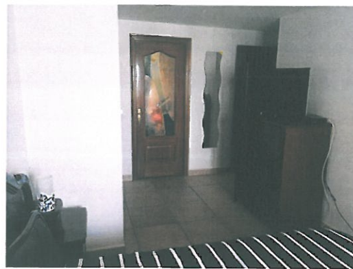
Schlafzimmer mit direktem Badezimmerzugang