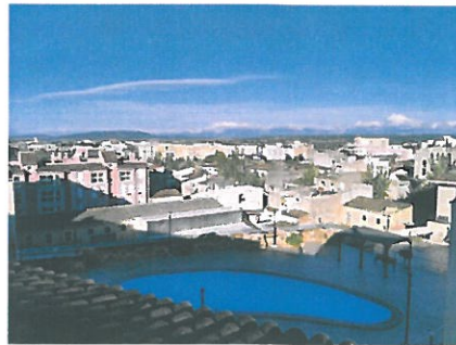
Blick von Gemeinschaftsdachterrasse über die Dächer von Manacor