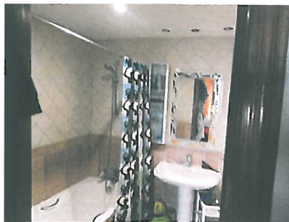
Bad mit Badewanne/Dusche