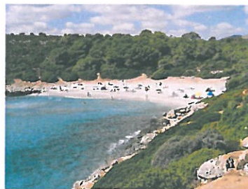
Cala Varques 11 km nach Manacor