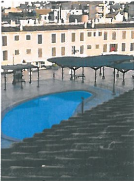
Poolanlage im Innenbereich